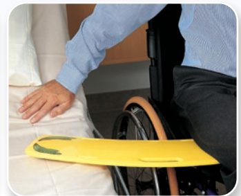
Équipement de soins infirmiers SAMARIT

Téléchargez sur notre site une brochure dans votre langue ou adressez-vous à votre distributeur local.